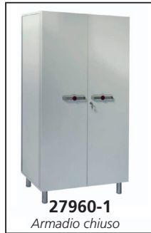
27960-1 Armadio chiuso