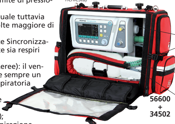
Tubo campionamento flusso