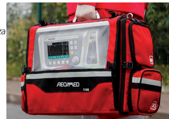
Borsa per il trasporto dotata di staffe

Modalità multiple di alimentazione - batteria interna a lunga durata 4,5 h - adattatore alimentazione CA - cavo di alimentazione CC per veicoli (su richiesta)