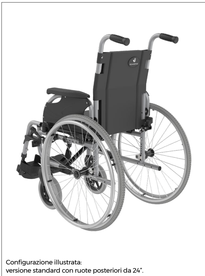
Configurazione illustrata: versione standard con ruote posteriori da 24".

ICON 10 è una scelta che assicura sicurezza e affidabilità. Offre un'ampia gamma di regolazioni per soddisfare le esigenze dell'utilizzatore e di chi lo assiste, offrendo il miglior supporto possibile nella vita quotidiana. Le ruote anteriori, le ruote posteriori, le pedane, i braccioli e i freni sono disponibili in varie dimensioni (OPTIONAL su richiesta) Gli accessori e i ricambi possono essere utilizzati anche su altri modelli ICON.