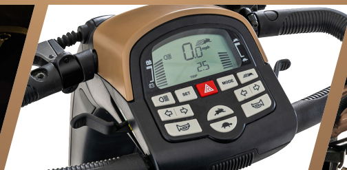
Console di facile utilizzo