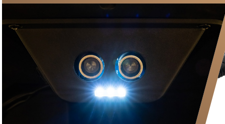
Sensore di backup con luci LED