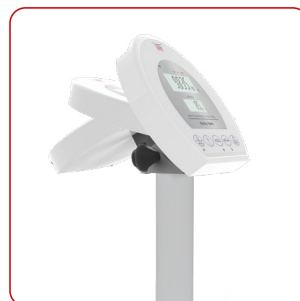
Visore WU150 reclinabile facilita la lettura dei risultati