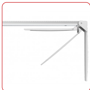
Palette pieghevoli per liberare superficie quando non in uso

Offre ampio spazio interno con ripiano regolabile, per collocare tutto il necessario per trattare un neonato